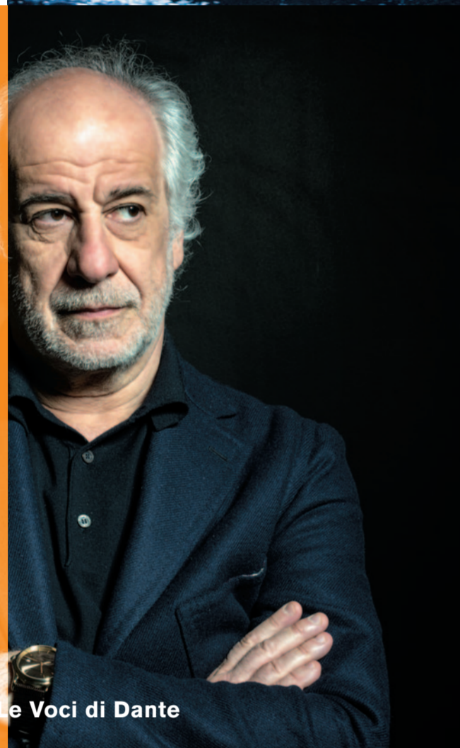
Le Voci di Dante